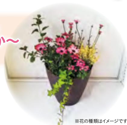
※花の種類はイメージです。